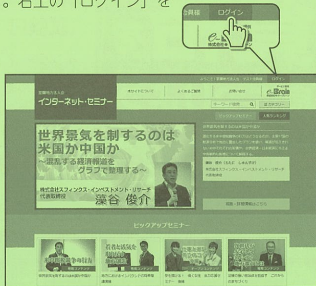
図② 「ログイン」をクリック