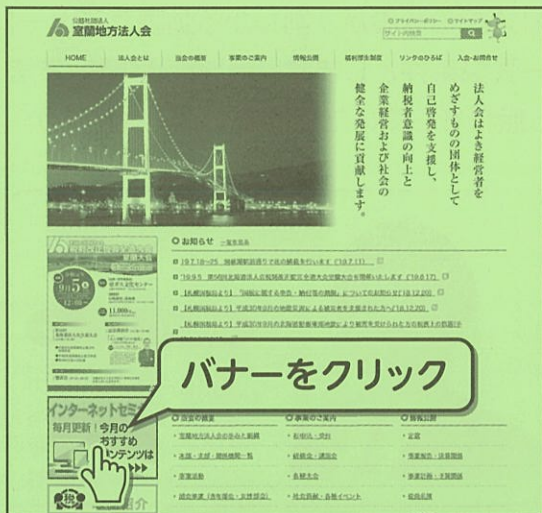
図① 「室蘭地方法人会」ホームページ