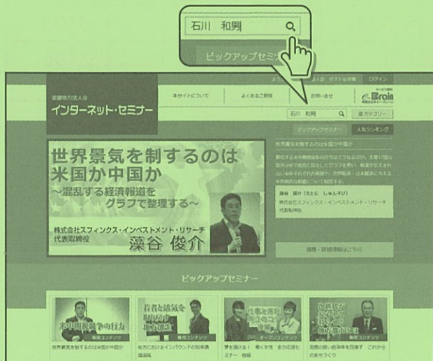
図④ キーワード検索