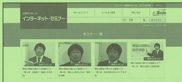
図⑤ セミナー一覧画面